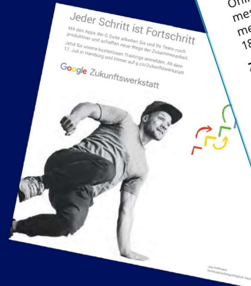
Bild: Google Quelle: Trend Research Hamburg i.A. der Score Media Group