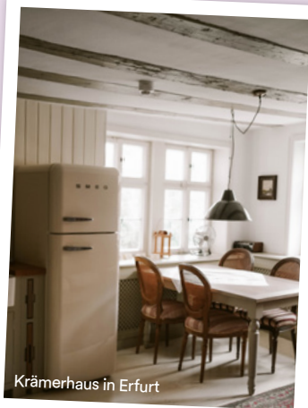
Krämerhaus in Erfurt

Von der Großstadt in die Natur: Auf dem Brandenburger Werbelinsee konnten die zwei in Altenhof dem Großstadtturbel auf dem SUP-Board entfliehen. Neben einem ausgiebigen Picknick-Ausflug in Halle und einem Abstecher zur BUGA 2021 in die Thüringer Landeshauptstadt Erfurt lernten die zwei das Bio-Dorf Schmilka in Bad Schandau kennen und lieben.