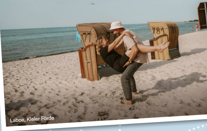
Laboe, Kieler Förde