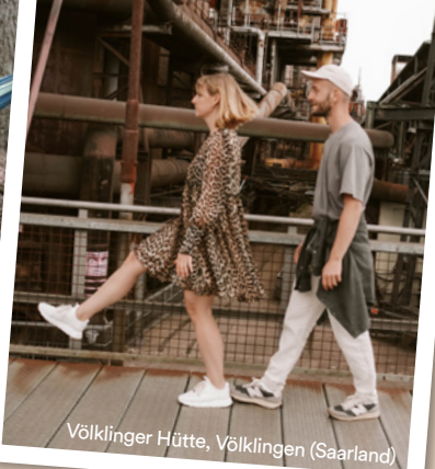
Völklinger Hütte, Völklingen (Saarland)