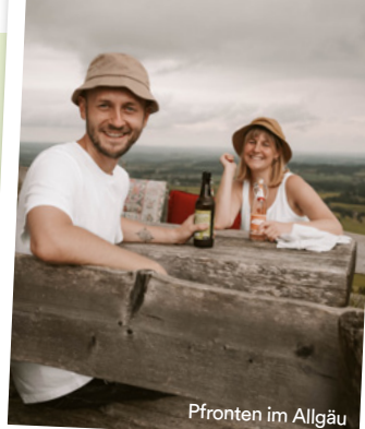
Pfronten im Allgäu