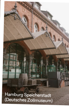
Hamburg Speicherstadt (Deutsches Zollmuseum)