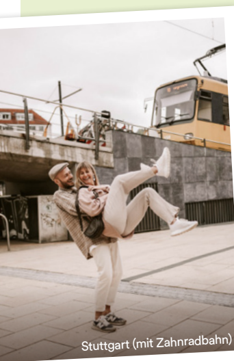
Stuttgart (mit Zahnradbahn)

Auch das Nachbarbundesland hatte so einiges zu bieten – z. B. die Zacke, eine von nur noch vier aktiven Zahnradbahnen Deutschlands. Auch das Quizwissen wurde aufgefrischt, denn wer hätte gedacht, dass in Stuttgart die erste Brezel gebacken und der erste Fernsehturm erbaut wurde?