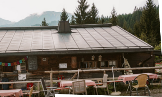
Hundeleckshütte in Pfronten