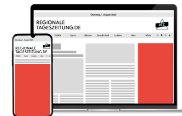
Halfpage Ad Plus

High Impact AdBundle Plus Online 1 Woche Brutto CpM 75€