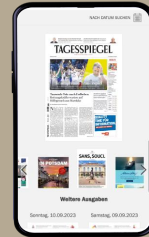
Praxisbeispiel | TUI