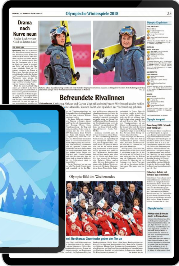
Visualisierung beispielhaft.