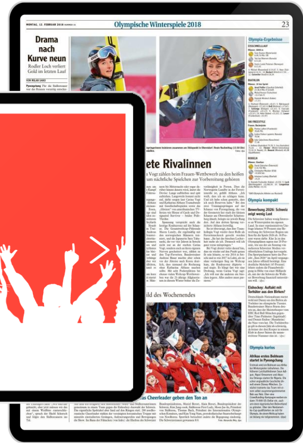
Visualisierung beispielhaft.